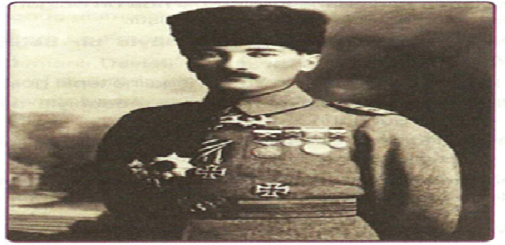
9. Ordu Müfettişi Mustafa Kemal Paşa