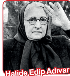
Halide Edip Adıvar

İnebolu'da bulunan cephanelerin Ankara'ya götürülmesinde çocuğu ve kağnısıyla yer alırken, ağır kış şartları nedeniyle Aralık 1921'de donarak şehit oldu.