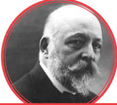
Mehmet Emin YURDAKUL

Ziya Gökalp, Namık Kemal, Mehmet Emin Yurdakul ve Tefik Fikret; Mustafa Kemal Atatürk'ü vatanseverlik ve milliyetçilik düşünceleri ile etkilemişlerdir. Ayrıca Tefik Fikret batıcılık fikirleri ile Mustafa Kemal Atatürk'ün inkılapçı bir kişilik kazanmasında da etkili olmuştur. Mustafa Kemal Atatürk, her fırsatta bu değerli yazarların fikir hayatına yaptıkları katkıdan söz etmiştir.