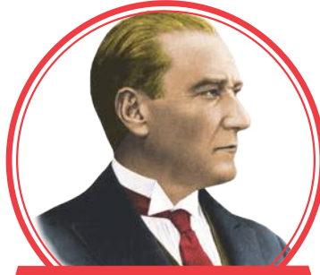
Mustafa Kemal ATATÜRK