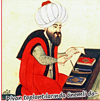
Divan toplantılarında önemli davalarla bakardı. Kadıların atamalarından sorumlu Divan üyesiydi.