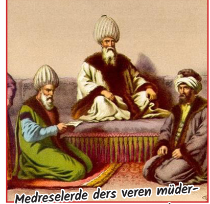
Medreselerde ders veren müderrislerden ve onların atamalarından sorumlu kişiydi.