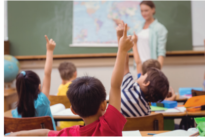
Sınıfta derse katılan çocuklar