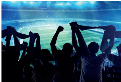
Takımını destekleyen insanlar