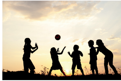
Top oynayan çocuklar