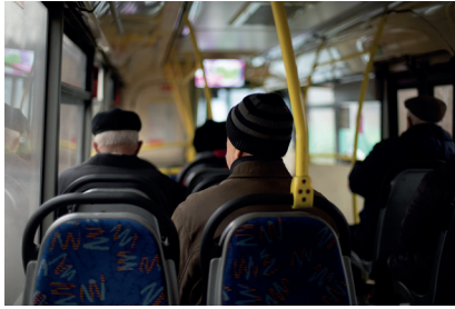
Otobüste seyahat eden insanlar

Aşağıda bazı görseller verilmiştir. Açıklamaları da dikkate alarak görseldeki bireylerin rollerini altlarındaki boşluklara yazınız.