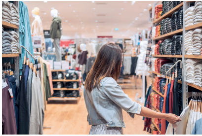
Mağazada alışveriş yapan kadın