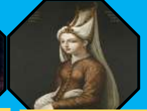
Mihrimah Sultan (Temsili)