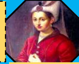
Hürrem Sulta (Temsili)

Selçukluda olduğu gibi Osmanlıda da kadınlar sosyal hayatın içinde yer almış bir çok cami, medrese, şifahane, imarethane gibi eserler yaptırmıştır. Örneğin Hürrem Sultan Haseki Darüşşifası, Çifte Hamam ve Medresesi, Mihrimah Sultan Mihrimah Sultan Külliyesi, cami, medrese, çifte hamam, çarşı, türbe ve sıbyan mektebi bu eserlere sadece iki örnektir.