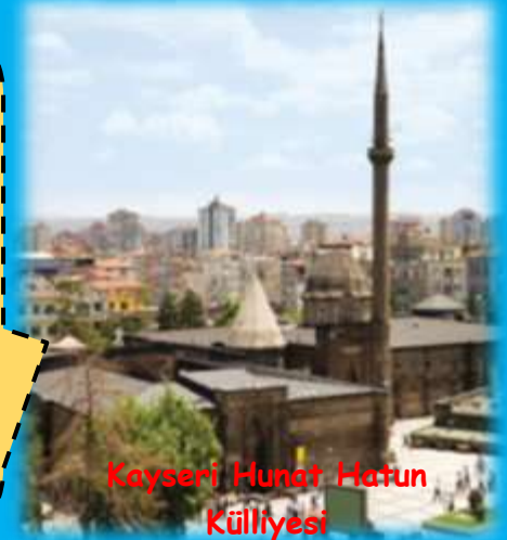
Kayseri Hunat Hatun Külliyesi

Vakıflar: Selçuklu ve Osmanlı döneminde toplumun eğitim sağlık gibi birçok ihtiyacını karşılamak amacıyla varlıklı kişiler tarafından kurulmuş olan kurumlardır. Bu kurumlar toplumun ihtiyaçlarını ücretsiz şekilde karşılamıştır.