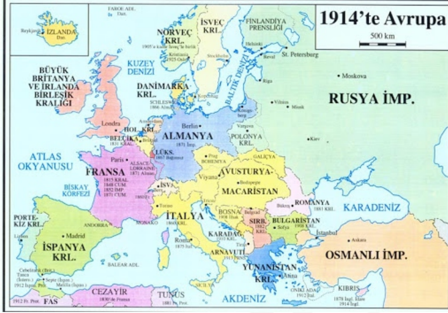
(20. yy başlarında Osmanlı Devleti ve Avrupa sınırları)

Görselden hareketle aşağıdaki yargılardan;