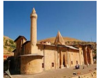
B) Divriği Ulu Camii