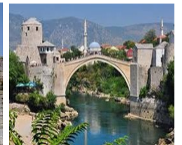
D) Mostar Köprüsü