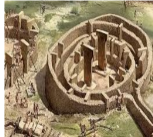
A) Göbekli tepe

8. Aşağıdaki ortak miras ürünlerinden hangisi ülkemizde bulunmaz ?