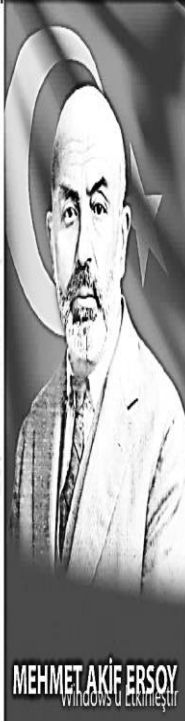
MEHMET AKİF ERSOY Windows 10 Ekranı

Ersoy, ödül olarak verilen 500 lirayı bir hayır kurumuna bağışladı.