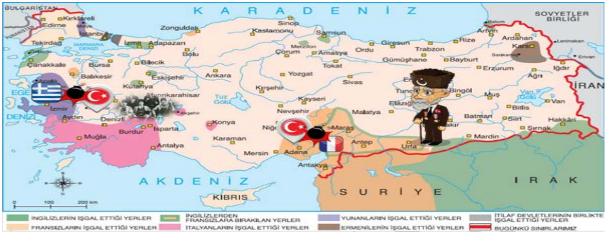
Mondros Ateşkes Antlaşması'ndan sonra Kuva-yı Milliye birliklerinin mücadele ettiği yerler

İzmir'in işgali, Millî Mücadele açısından bir dönüm noktası oldu. Çünkü o zamana kadar işgallerin geçici olacağını düşünen Türk milleti, vatanın elden gitmek üzere olduğunu anladı ve vatan savunmasını fiilen üstlendi. Harekete geçen Türk milleti önce direniş cemiyetleri ardından da Kuvayı Milliye birlikleri oluşturarak vatanını savunmaya başladı. Kuvayı Milliye adı verilen bu birlikleri daha ziyade terhis edilen Osmanlı ordusunun subay kadroları yönetiyordu. Terhis edilen askerlerin de yer aldığı bu birliklere eli silah tutan kadın-erkek bütün vatanseverler katılabilirdi. Büyük çoğunluğunu sivil halkın oluşturduğu bu birliklerin ihtiyaçları da yine halk tarafından karşılanıyordu. Çerkez Ethem, Demirci Mehmet Efe ve Yörük Ali Efe gibi liderler tarafından komuta edilen Kuvayı Milliye birlikleri, Batı Anadolu'da terhis edilen ordumuzdan kalan boşluğu doldurmaya çalıştı.