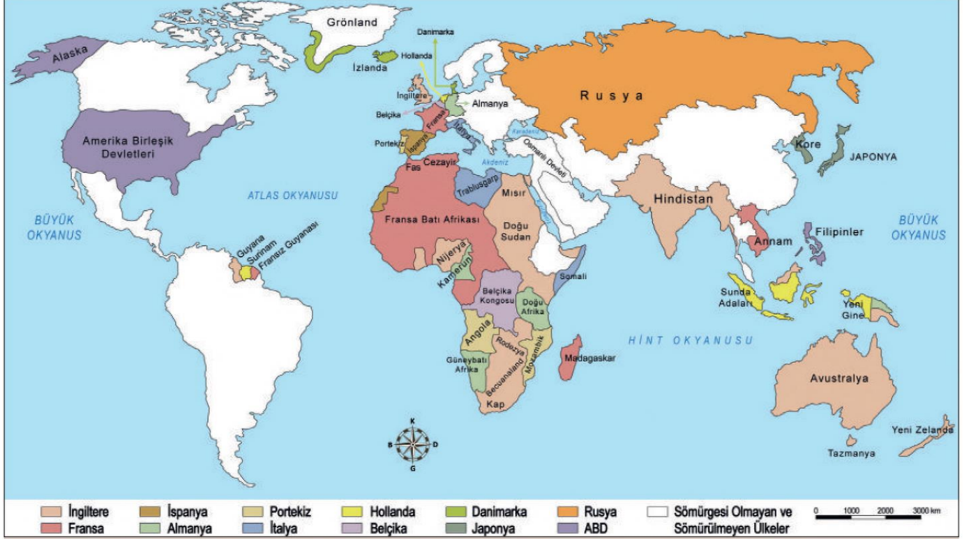
XX. Yüzyılın başlarında sömürgeci devletler ve sömürgelerin dağılımı