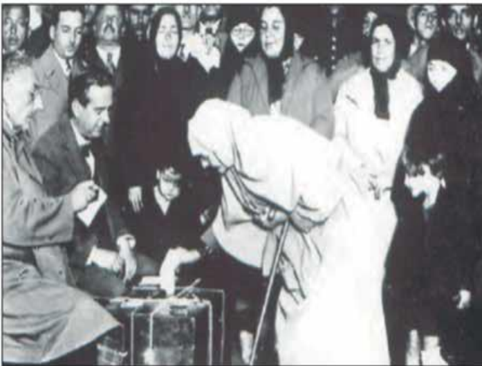
1935 Milletvekili Seçimlerinde Vatandaşlar Oy Kullanırken

Bu fotoğraf dikkate alındığında Cumhuriyetin ilk yılları için,