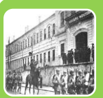
İstanbul Harp Okulu

Mustafa Kemal, 1899 yılında İstanbul'a giderek Harp Okulu'nun Piyade Bölümüne girdi. 1902'de bu okulu teğmen rütbesiyle bitirdi ve öğrenimine Harp Akademisi'nde devam etti. Atatürk, bir yandan öğreniminde başarılı olmak için sürekli çalışıyor bir yandan da ülkenin kaderine kafa yoruyordu. Zira ülkenin siyasetinde yanlışlar olduğunu fark etmişti. Ülkedeki yanlışlar