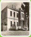
Şemsi Efendi İlkokulu

Mustafa Kemal öğrencilik yıllarında dini eğitim veren medrese ve mektepler, askeri okullar, modern okullar, yabancı okulları, azınlık okulları bulunuyordu. Bu durum Osmanlı Devleti'nde eğitim birliği olmadığını göstermektedir.