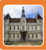
Manastır Askeri İdadisi