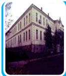
Selanik Mülkiye Rüştiyesi

Babasının isteği ile gittiği bu okul Selanik'in ilk özel Müslüman okuludur. Mustafa Kemal bu okulda modern bir eğitim görmüştür. Bu okulda iken babası 1888 yılında vefat edince kısa sürede olsa eğitim hayatı kesintiye uğramıştır.