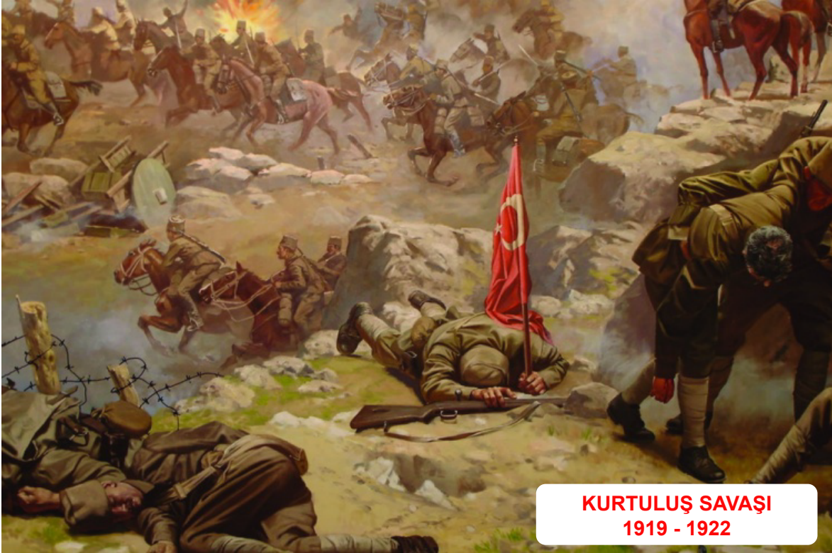
KURTULUŞ SAVAŞI 1919 - 1922

Görselde vurgulanmaya çalışılan konudan hareketle bir şiir seçmek isteyen Arda, aşağıdakilerden hangisini kullanabilir ?