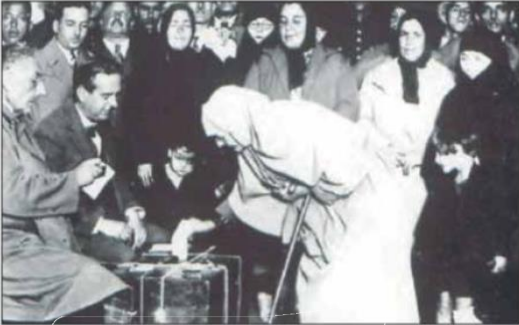
1935 Milletvekili Seçimlerinde Vatandaşlar Oy Kullanırken

Bu fotoğraf dikkate alındığında Cumhuriyetin ilk yılları için,