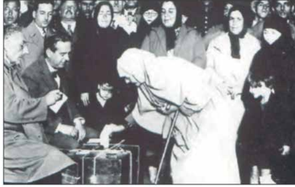
1935 Milletvekili Seçimlerinde Vatandaşlar Oy Kullanırken

Bu fotoğraf dikkate alındığında Cumhuriyetin ilk yılları için,