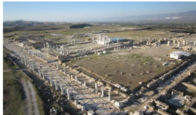
Laodikya Antik Kenti