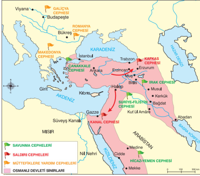
Harita: Birinci Dünya Savaşı'nda Osmanlı Devleti'nin savaştığı cepheler

5. Aşağıda Osmanlı Devleti'nin I. Dünya Savaşı'nda savaştığı cepheleri gösteren harita verilmiştir.