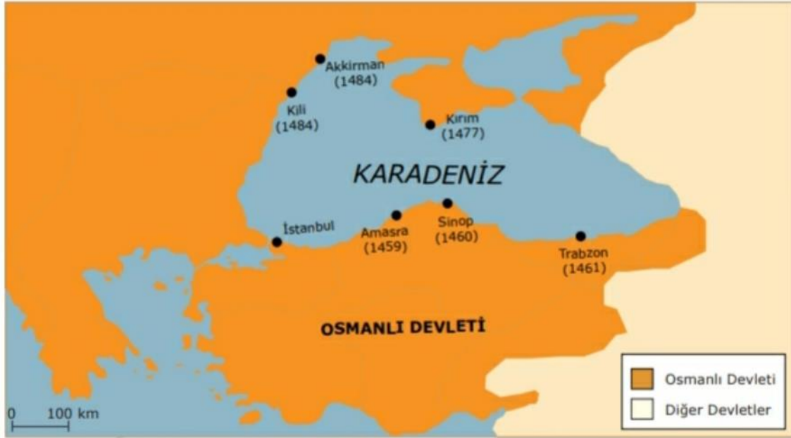
Harita 2.5: Osmanlı Devleti'nin Karadeniz Kıyı Fetihleri (1459-1484)

Ege Denizi'nde güvenlik sağlandıktan sonra İstanbul'dan başlayarak doğuya doğru Karadeniz'in Anadolu kıyıları ele geçirilmiştir. İSTANBUL , SİNOP , AMASRA , TRABZON ve Kuzeyde stratejik önemi olan Kırım Yarımadası'nın alınması ile Fatih döneminde Karadeniz Osmanlı Devleti'nin denetimine girmiştir.