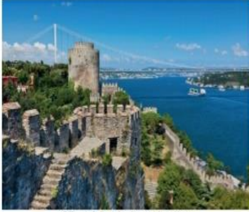
Görsel 2.10: Rumeli Hisarı