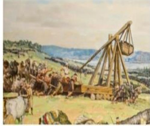
Görsel 2.13: Mancınıkların Hazırlanması (Temsilî)

Fatih Sultan Mehmed'in fetih için yaptığı tüm hazırlıklar yaşamış olduğu çağın bilim ve teknolojisinden de faydalandığını göstermektedir. Bu teknolojinin de yardımıyla II. Mehmed 54 gün içerisinde geçilmez sanılan surları yıkıp fethi gerçekleştirmiştir.