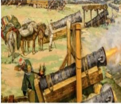
Görsel 2.12: Şâhi Topları (Temsilî)