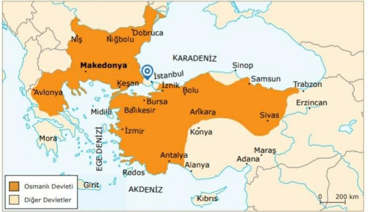
Harita 2.4: II. Murad Dönemi Osmanlı Devleti Toprakları (1421-1451)