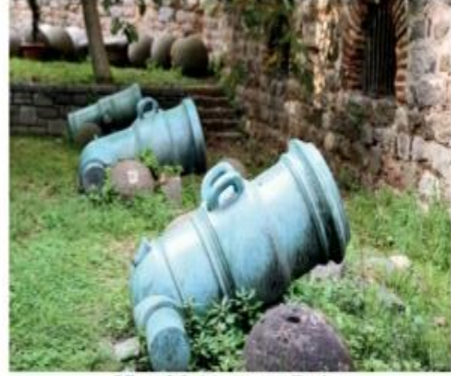
Görsel 2.11: Havan Topları