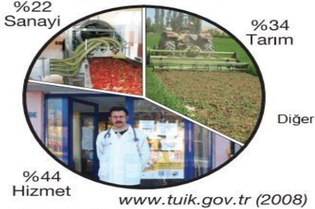
Çalışan Nüfusun Ekonomik Faaliyetlere Göre Dağılımı Grafiği