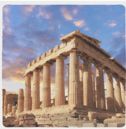
a) Atina (...Yunanistan...)

E) Başkentlerinden görüntüler verilen komşularımızın adlarını doğru şekilde yazınız.