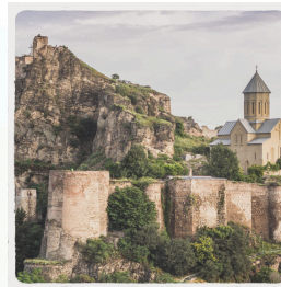
c) Tiflis (...Gürcistan...)