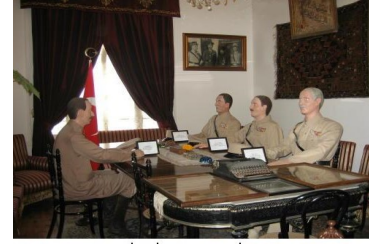
Mudanya Mütareke Es: İsmet İnönü ve karşısında İngilizlere temsilcisi General Harrington, Fransız temsilcisi General Chanzy ve Rusya temsilcisi General Monbelle