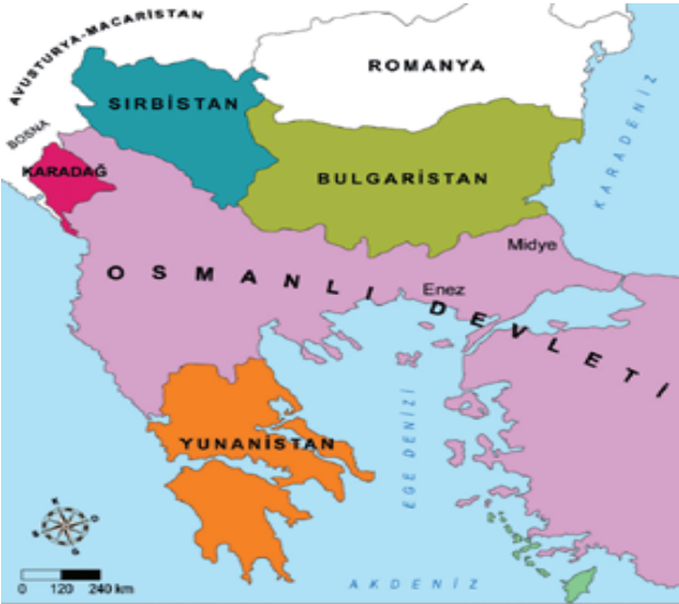
I. Balkan Savaşı öncesinde Balkanlar