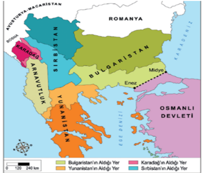
I. Balkan Savaşı sonrasında Balkanlar

Bu haritalara göre I. Balkan Savaşı'nın sonuçları ile ilgili aşağıdakilerden hangisi söylenemez?