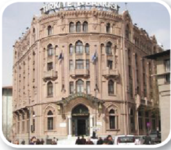
Türkiye İş Bankası