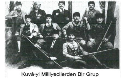
Kuvâ-yı Milliyecilerden Bir Grup