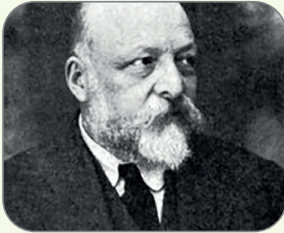
Mehmet Emin Yurdakul

Eserlerinde vatan ve hürriyet konularını işlemiştir. Bu eserler Mustafa Kemal'de .....sevgisinin oluşmasında etkili olmuştur.