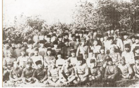
TBMM'nin kurduğu düzenli ordu

Yalnızca görseller dikkate alındığında bu değişimin asıl nedeni olarak Kuvâ-yı Milliye'nin hangi özelliği etkili olmuştur?