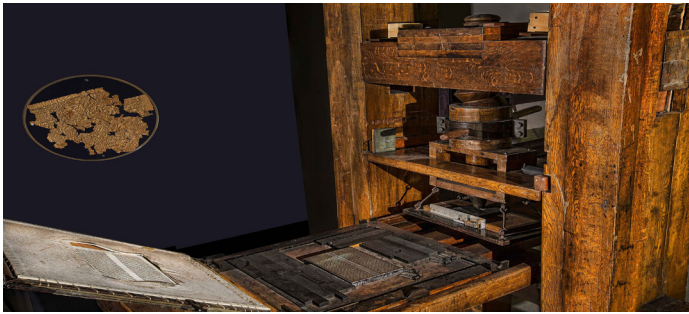
İlk modern matbaa'dan görünüm

1455'te ayrı ayrı hazırlanmış kurşun harfleri yan yana dizerek baskı yapan matbaayı icat etti.