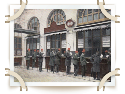
Posta Nezareti kuruldu.