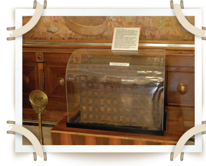
Memleket Sandıkları oluşturuldu.