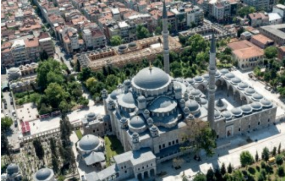
Fatih Külliyesi ve Sahn-ı Seman Medresesi

Osmanlı Devleti'nde ilk medrese Orhan Bey döneminde İznik'te kuruldu. Fatih Sultan Mehmet tarafından İstanbul'da yaptırılan Sahn-ı Seman Medresesi dönemin en büyük eğitim kurumuydu. Medreselerde alanında uzman "müderris" adı verilen hocalar eğitim verirdi. "Sıbyan" adı verilen mahalle mekteplerinden mezun olanlar, medreselerde orta ve üst düzey eğitim alabilirlerdi. Medreselerde eğitim ve barınma parasızdı. Medrese öğrencilerinin ihtiyaçlarının çoğu vakıflarca karşılanırdı.