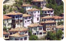
Safranbolu Evleri III.

6. Yukarıdakilerden hangisi ya da hangileri doğal varlıklarımızdandır?