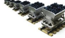
Yer altı kaynakları