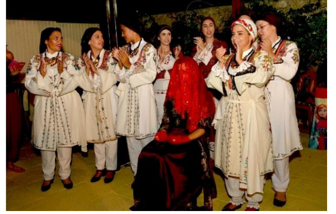
KKTC'de bir kına eğlencesi.

Kına gecesinde, geleneksel Kıbrıs müzikleri çalınır ve halk dansları yapılır. Özellikle "karşılamalar" ve "mendil oyunları" gibi danslar, bu gecenin vazgeçilmezlerindendir.