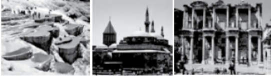
Pamukkale Travertenleri Denizli