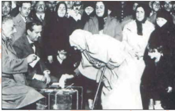
1935 Milletvekili Seçimlerinde Vatandaşlar Oy Kullanırken

Bu fotoğraf dikkate alındığında Cumhuriyetin ilk yılları için,