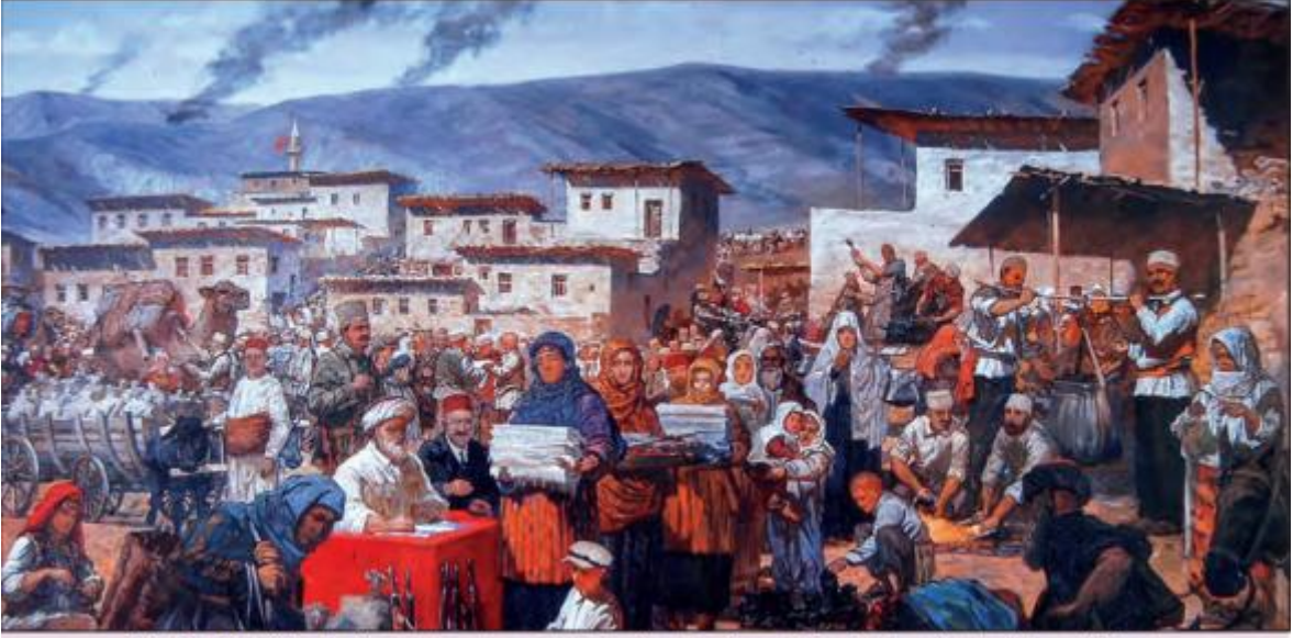
3.23 Teklif-i Milliye Emrilerinin Uygulanışı, Atatürk ve Kurtuluş Savaşı Müzesi, Ankara (Aydın Erkmen Tablosu)