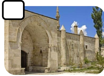
Mama Hatun Külliyesi