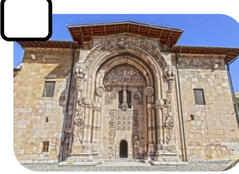
Divriği Ulu Cami