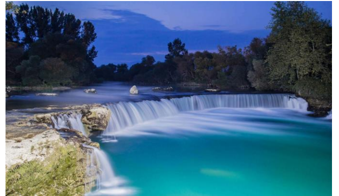
Manavgat Şelalesi- Antalya