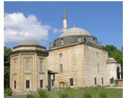
Mustafa Paşa Cami-Kocaeli