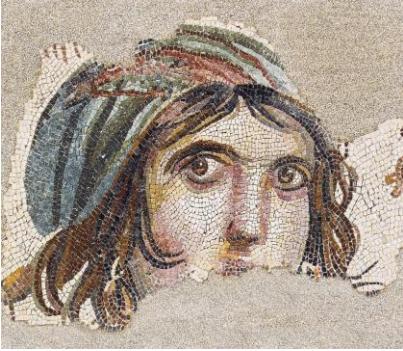
Zeugma Antik Kenti Gaziantep