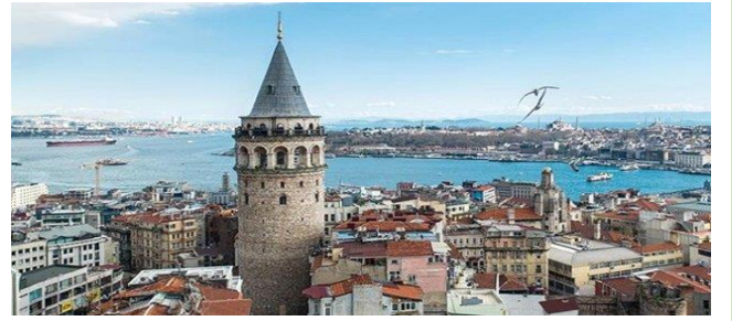
Galata Kulesi- İstanbul