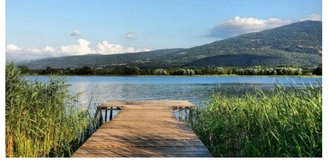
Sapanca Gölü- Sakarya