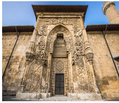
Divriği Ulu Cami-Sivas