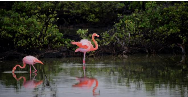
Manyas Kuş Gölü- Balıkesir

1.Doğal Varlıklarımız: Doğada kendiliğinden oluşan, gezilip görülebilecek özellikte olan varlıklardır. Örneğin; Dağ, ova, göl, deniz, orman, nehir...) Ülkemizde birçok doğal güzelliğe ev sahipliği yapmaktadır. Şimdi bunlardan bazılarını inceleyelim.