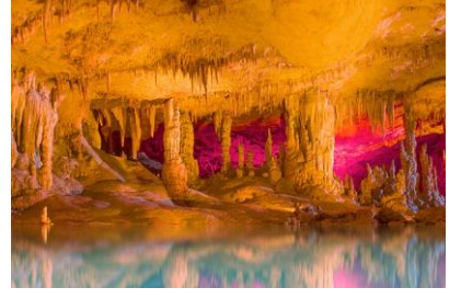
Cennet, Cehennem Mağarası- Mersin