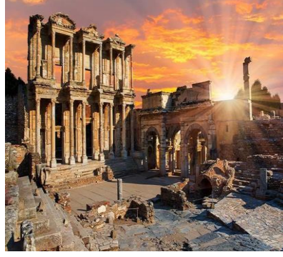
Efes Antik Kenti-İzmir