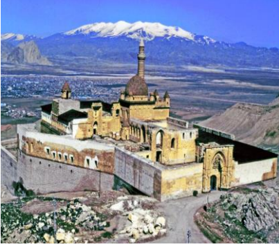
İshak Paşa Sarayı-Ağrı