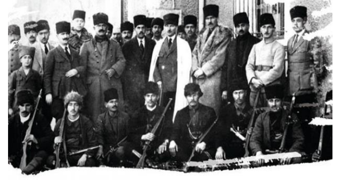
Mustafa Kemal ve Kuvay-i Milliye

Osmanlı Devleti 1.Dünya Savaşı'ndan yenik çıkmıştı. İtilaf Devletleri Mondros Ateşkes Antlaşması'nın 7. Maddesine dayanarak Anadolu'da işgallere başladılar. Osmanlı Devleti başlayan işgaller karşısında tepkisiz kaldı. Osmanlı Devleti'nin işgaller karşısında tepkisiz kalması üzerine Türk milleti bağımsız yaşama arzusu ile yöresel silahlı direniş örgütleri kurmuştur. Kurulan bu direniş örgütlerine Kuvay-i Milliye denir. Kuvay-i Milliye birlikleri, Yunanların 15 Mayıs 1919'da İzmir'i işgal etmesinden sonra yoğun olarak Batı Anadolu'da kurulmuştur. Kuvay-i Milliye birlikleri güneyde Fransızlara, batıda Yunanlara karşı koyarak işgalleri engellemeye çalıştı. Ermeni ve Rum çetelerine karşı halkı korudu.