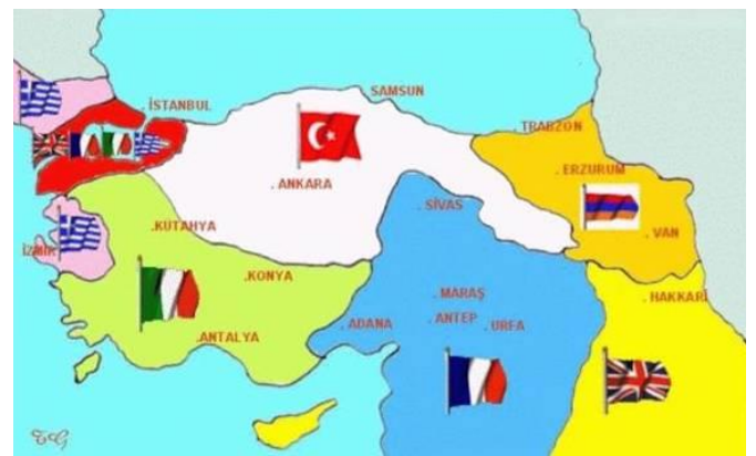
Mondros Ateşkes Antlaşmasına Göre İşgal Edilen Yerler