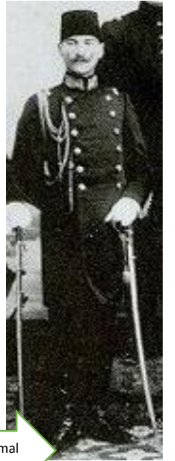
İstanbul Harp Okulu'nu okuduğu sırada Mustafa Kemal

Harp okulundan teğmen rütbesi ile mezun olan Mustafa Kemal, akademiye girmiş ve burada 1902 – 1905 yılları arasında eğitim gördükten sonra kurmay yüzbaşı rütbesi ile mezun olmuştur.