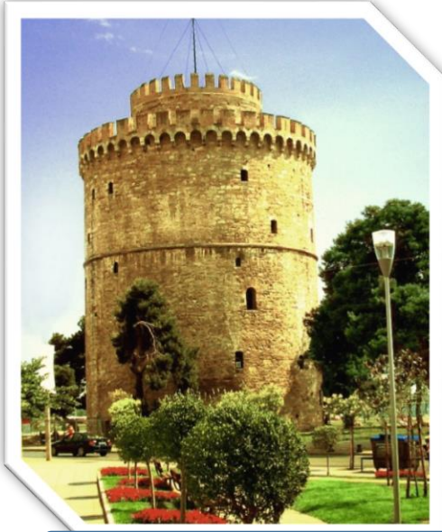
Selanik'in simgesi Beyaz Kule

Selanik şehri farklı ulusları barındırması nedeniyle farklı inançların da merkezi olmuştur. Farklı dinlere inanan uluslar yüzyıllar boyunca burada hoşgörü politikası doğrultusunda yaşamışlardır.