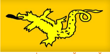
ASYA HUN İMPARATORLUĞU BAYRAĞI