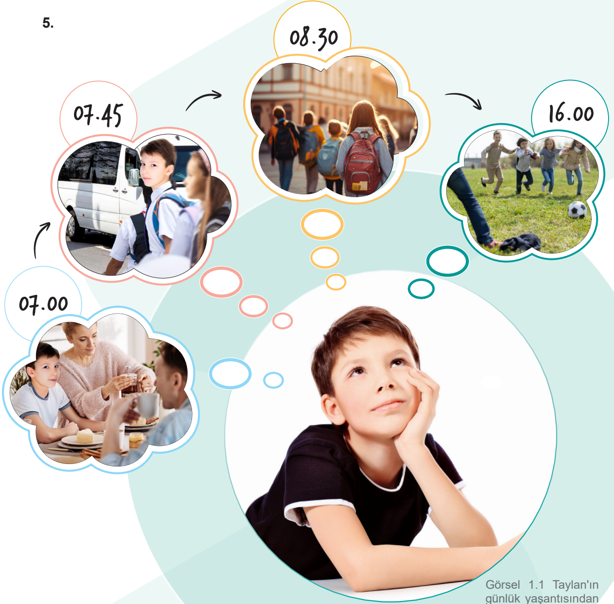
Görsel 1.1 Taylan'ın günlük yaşantısından örnekler

Görsellere göre Taylan ile ilgili aşağıdaki sorulardan hangisinin cevabına ulaşamaz ?