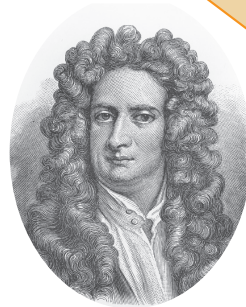
NEWTON (NİVTİN) (1643-1727)

Matematikçi, fizikçi, kimyacı, felsefeci ve ayrıca mucidim. Gökyüzünü ve yıldızları inceledim, gözlemler yaptım, kitaplar okudum ve notlar aldım. Işığın özellikleri ve doğası üzerine çok sayıda deney yaptım. Bir ağacın altında otururken kafama düşen elmanın neden yere düştüğünü sorguladım ve araştırmaya başladım. Elmanın yer çekimi nedeniyle düştüğünü buldum.