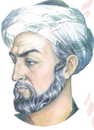
İBN-İ SÎNÂ (980-1037)

Küçük yaşta matematik, astronomi, fizik, felsefe, kimya ve tıp gibi farklı bilimleri merak etmeye başladım. Zamanımın büyük bölümünü kitap okumaya ayırdım. Öğrendiklerimi sorguladım, doğruluğunu araştırdım. Bunun için farklı bitkileri kullanarak deneyler yaptım. Tıp alanında çalışmalara ağırlık verdim. Hastaları gözlemledim.