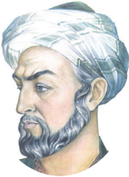
İBN-İ SÎNÂ (980-1037)

Küçük yaşta matematik, astronomi, fizik, felsefe, kimya ve tıp gibi farklı bilimleri merak etmeye başladım. Zamanımın büyük bölümünü kitap okumaya ayırdım. Öğrendiklerimi sorguladım, doğruluğunu araştırdım. Bunun için farklı bitkileri kullanarak deneyler yaptım. Tıp alanında çalışmalara ağırlık verdim. Hastaları gözlemledim.