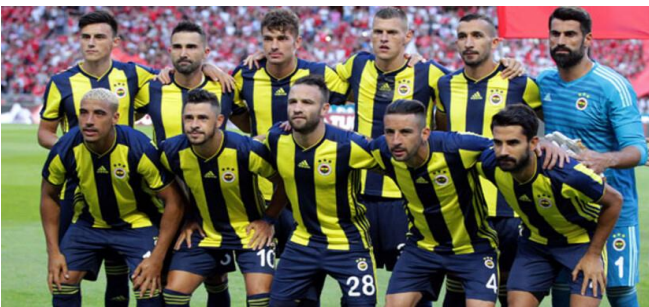
Fenerbahçe Takımı Bir Gruptur.

Ortak bir amaç için bir araya gelen, görüşleri çıkarları bir olan aralarında dayanışma ve işbirliği olan insan topluluğuna "Grup" denir. Örneğin; aile, okul, futbol takımı birer grup örneğidir.