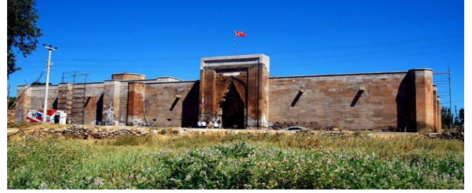
Ağzıkarahan Kervansarayı -AKSARAY

DÜNYADA SİGORTACILIK SİSTEMİ BİLİNMEZKEN ANADOLU'DA 800 YIL ÖNCE BU KERVANSARAYA GELEN TÜCCARLARIN CAN VE MAL GÜVENLİKLERİNİN ANADOLU SELÇUKLU DEVLETİ TARAFINDAN SİGORTALANDIĞI ORTAYA ÇIKTI. HOCA MESUT HANI ADIYLA DA BİLİNER KERVANSARAYA GELEN TÜCCARLAR, BURADA 3 GÜNLÜK KONAKLAMA YAPIYOR VE ARINDAN YOLLARINA DEVAM EDİYORLARDI. TÜCCARLARIN HER TÜRLÜ İHTİYAÇLARININ KARŞILANDIĞI KERVANSARAYDA KALANLARIN CAN VE MAL GÜVENLİKLERİ, ANADOLU SELÇUKLU DEVLETİ TARAFINDAN SİGORTALANIYORDU. TÜM İHTİYAÇLARI VAKIFLAR TARAFINDAN KARŞILANAN KERVANSARAY, DEVLETE HERHANGİ BİR MADDİ YÜK OLUŞTURMUYORDU. 3 GÜN BOYUNCA HİÇBİR BEDEL ÖDEMİYEN İNSANLAR, DAHA UZUN SÜRE KONAKLAMAK İSTEDİKLERİNDE İSE KÜÇÜK ÜCRETLERLE BURADA KALMAYA DEVAM EDEBİLİYORLARDI. AA