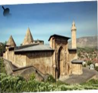
Sivas Divriği Ulu Cami