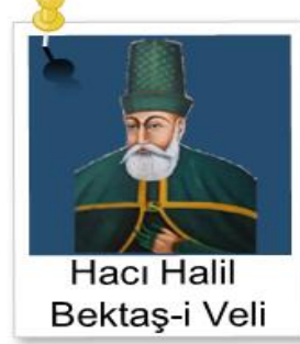
Hacı Halil Bektaş-i Veli