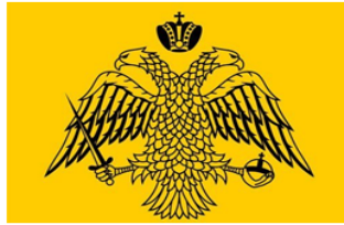
Bizans İmparatorluğu Roman Diyojen