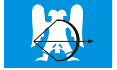
Türkiye Selçuklu Devleti

-Türklerin Anadolu'yu yurt edinmelerinden rahatsız olan Bizans'ın Türkleri Anadolu'dan atmak istemesi üzerine çıkan savaştır.