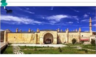
Mama Hatun Külliyesi