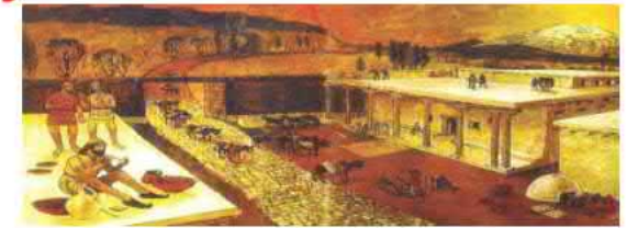
Kayseri Kültepe - Kanış Karumu (Pazar yeri)

Asurlar, Anadolu'ya yazıyı taşıyarak Anadolu'da Tarihi çağların başlamasını sağladılar.