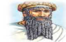
Babil Kralı Hammurabi