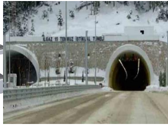
Ilgaz 15 Temmuz İstiklal Tüneli

3-)Ülkemizde yakın zamanda açılışı yapılan yukarıda resimleri verilen çalışmalar hakkında aşağıdaki yapılan hangi yorum daha doğru olur?