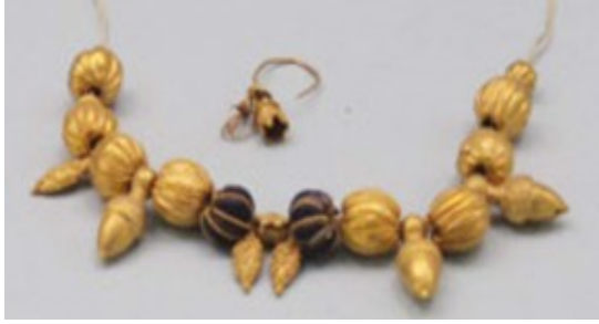
(Antalya Müzesi- Altın Kolye)